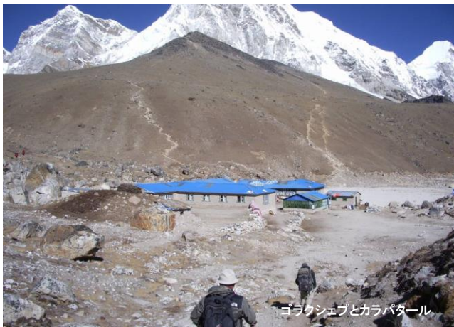
ゴラクシェブとカラパタール