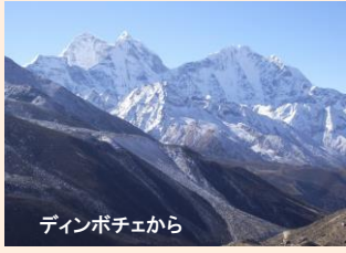
デインボチェから