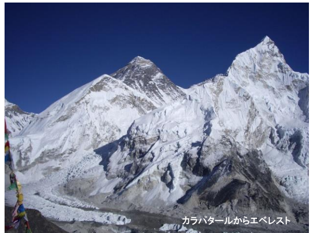
カラパタールからエベレスト

◎ このツアーについての詳しいお問合せ・ご相談は富士国際旅行社で受け付けております(ご来社歓迎) ◎