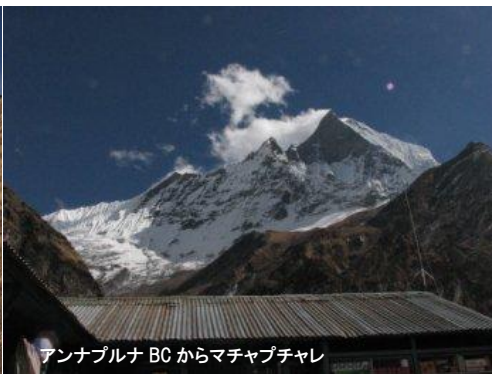
アンナプルナ BC からマチャブチャレ