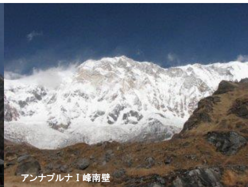
アンナプルナ I 峰南壁

◎ このツアーについての詳しいお問合せ・ご相談は富士国際旅行社で受け付けております(ご来社歓迎) ◎