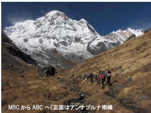
MBC から ABC へ(正面はアンナプルナ南峰)

※ 3001-0P(オプション)はツアー単位での設定となります(詳細はお問合せ下さい)