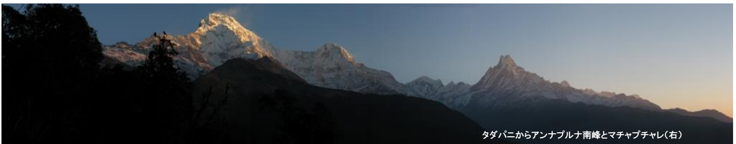
タダパニからアンナプルナ南峰とマチャプチャレ(右)

◎ このツアーについての詳しいお問合せ・ご相談は富士国際旅行社で受け付けております(ご来社歓迎) ◎