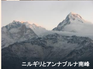
ニルギリとアンナプルナ南峰