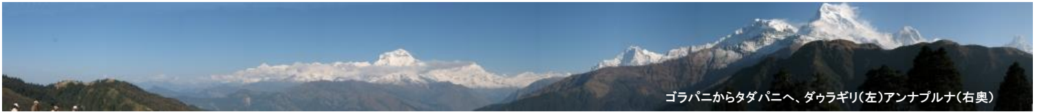
ゴラパニからタダパニへ、ダウラギリ(左)アンナプルナ(右奥)