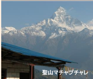
聖山マチャプチャレ