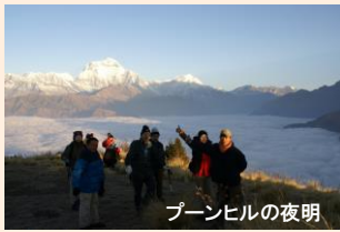
ブーンヒルの夜明