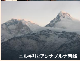
ニルギリとアンナプルナ南峰