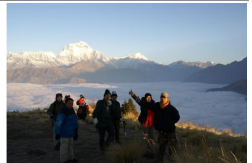
プーンヒルの夜明け