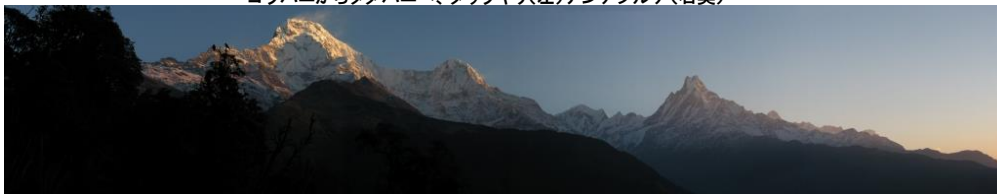
タダパニからアンナプルナ南峰とマチャプチャレ(右)

◎ このツアーについての詳しいお問合せ・ご相談は富士国際旅行社で受け付けております(ご来社歓迎) ◎