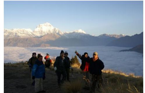
ブーンヒルの夜明