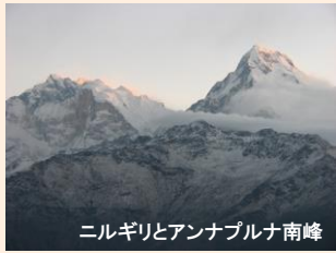
ニルギリとアンナプルナ南峰